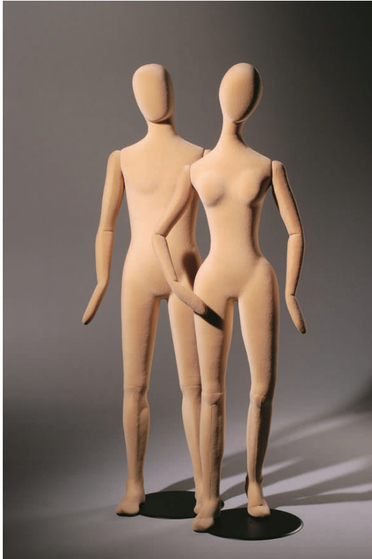
POLY1006F et POLY1061