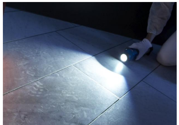
Pour la recherche d'empreintes de pas un filtre pour lumière rasante est relevé sur la lampe CSL-700.