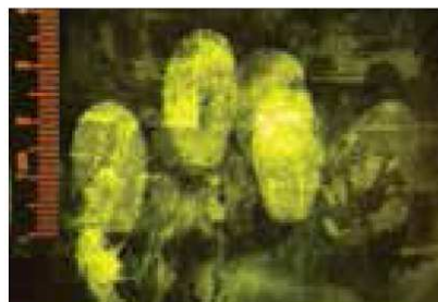
Observation d'une poudre jaune fluo avec le BUV100, à travers le filtre orange