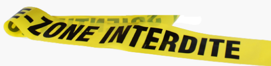
Ruban gel des lieux : GENDARMERIE NATIONALE - ZONE INTERDITE. 7.5cm *100m