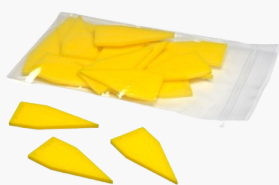
Indices repère flèches jaune