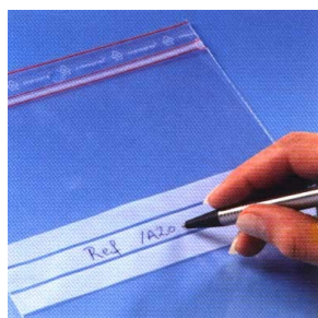
MINI06B à MINI23B