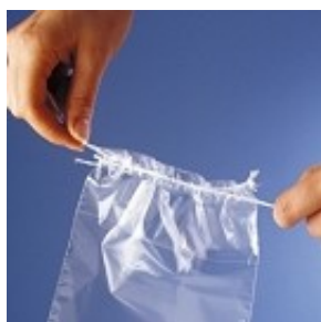
SA150 à SA400

Les sacs en plastique ou en papier, les flacons, pots, piluliers en verre ou en plastique ainsi que les boîtes cartonnées composent l'essentiel de notre offre.