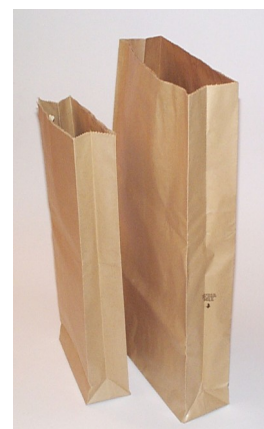
91408 à 91411